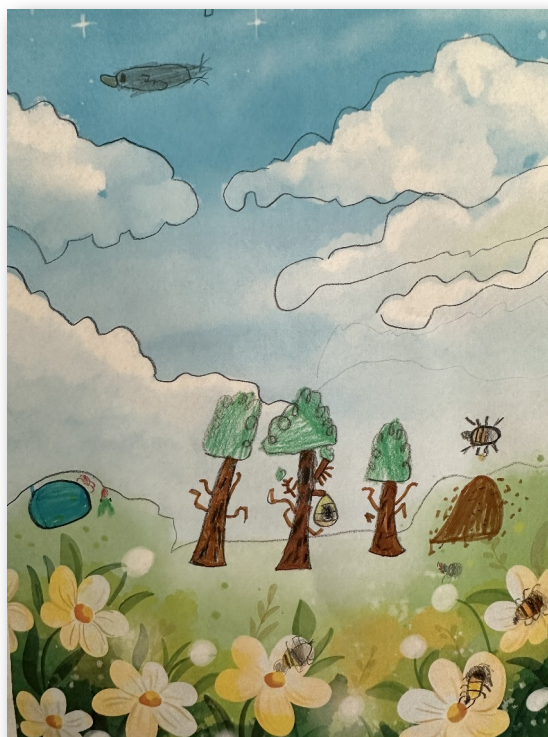
Obrázek nakreslil Marko