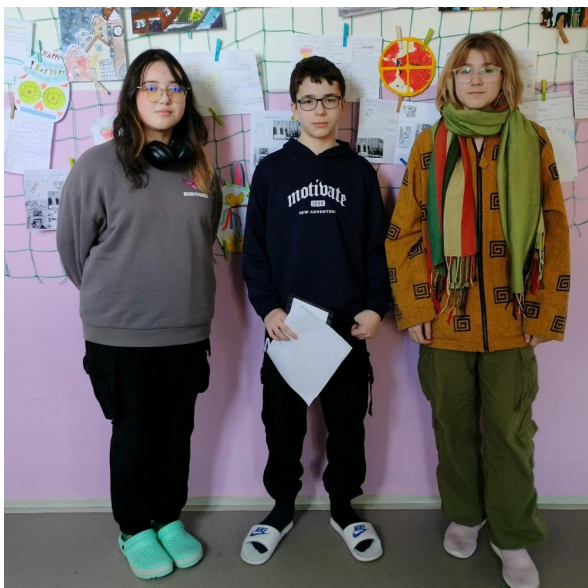
Předání kupónu na předběhnutí fronty v jídelně

Nejen na jaře, ale po celý rok chodíme do školy, a tak si občas všimneme, že někteří učitelé používají některé věty častěji, a ty se potom pro žáky stanou hláškami. Poznáte, která z hlášek patří komu? A když už jsme u toho hledání, připravili jsme si pro vás fotky různých koutů naší školy. Schválně jestli poznáte, kde co je.