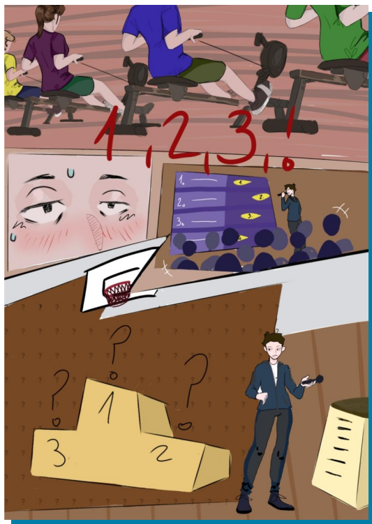
Nový komiks od Hany!

To záleží na tom, jestli chcete veslovat ve vodě nebo na souši. K veslování na vodě jsou potřeba jenom loď a vesla.